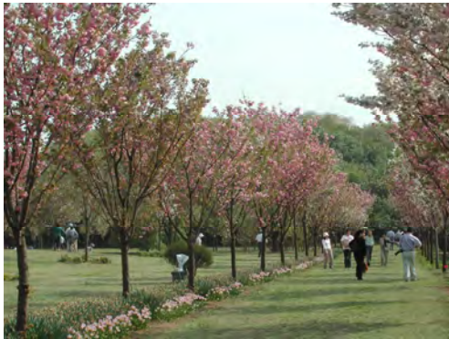
十色桜の並木(モデルガーデン)

日本各地や欧米・韓国・中国などから収集した350品種の桜を保存し、品種の特性調査や優良品種の選抜、保護育成に関する研究などに取り組んでいます。また、多彩な品種を活用したモデルガーデンを設け、個性的な名所づくりを提案しています。