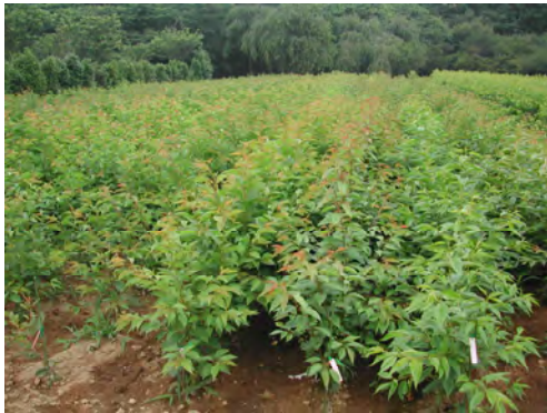
苗木は約2年間かけて育成されます。

全国各地で取り組まれる「桜の名所づくり」活動を支援するため、優良品種の苗木を生産・配布しています。創立以来、国内外に配布した累計本数は220万本に達しています。オオシマザクラやエドヒガンの実生苗などを台木として、接木によって育成された桜の苗木は落葉後、全国に出荷され、3年後には美しい花を咲かせ始めます。