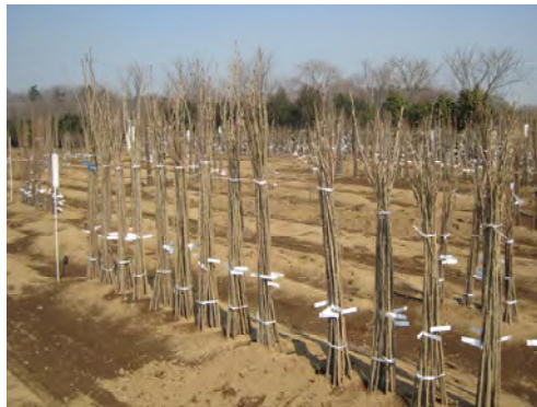
成長した苗木は各地に発送されます。