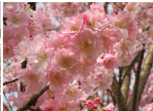
舞姫は当会でつくられた新品种です。