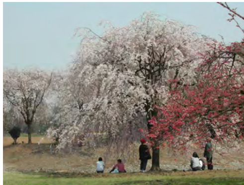
憩いの広場(モデルガーデン)