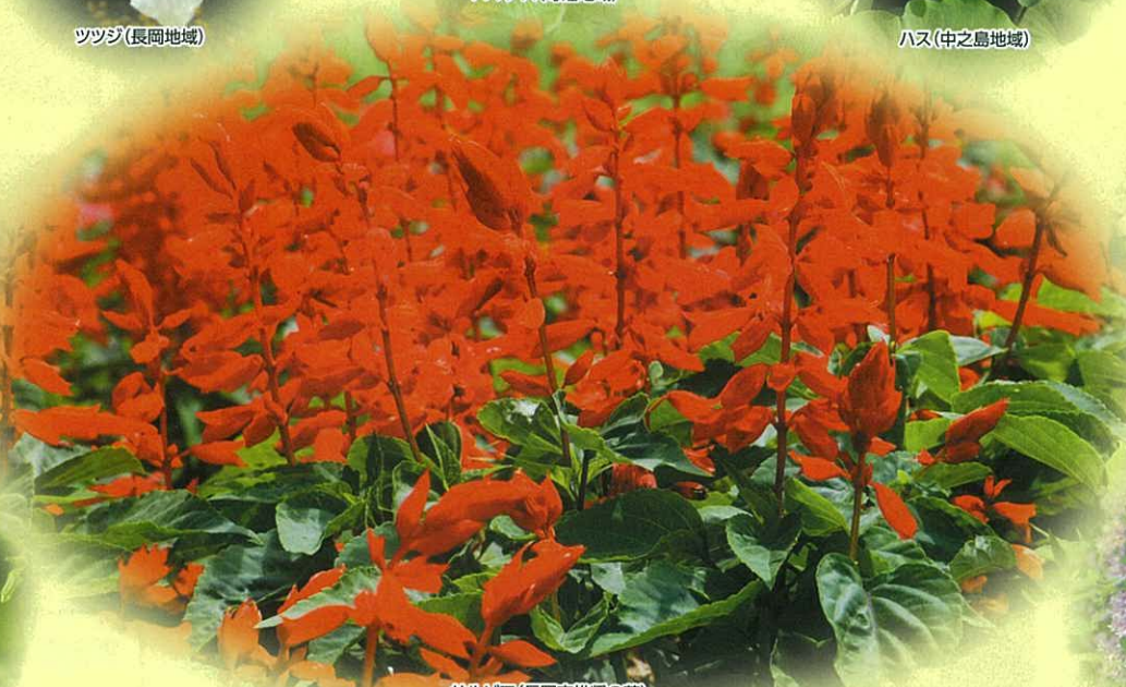
サルビア(長岡市推奨の花)