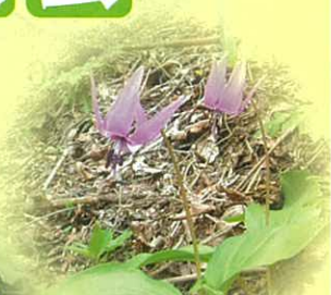
カタクリ(三島地域)