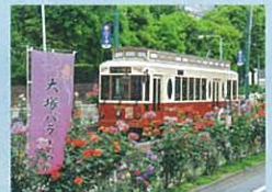
南大塚都電沿線協議会