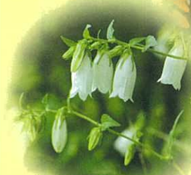
ホタルブクロ(越路地域)