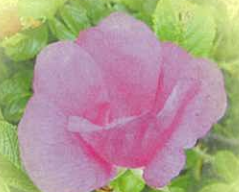
ハマナス(寺泊地域)