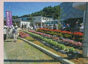
※写真は7月頃の様子です てまりケアセンター