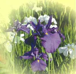
はなしょうぶ 花菖蒲(与板地域)