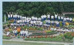
長岡市立山本中学校