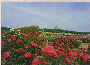
国営越後丘陵公園(バラ)

雪国越後の里山をそのまま利用し、自然生態系を大切に造り上げた植物園です。ヒメサユリおよそ1万本が見頃を迎え、春の山野草展示即売会も実施しています。