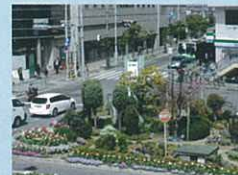
高槻景観園芸クラブ