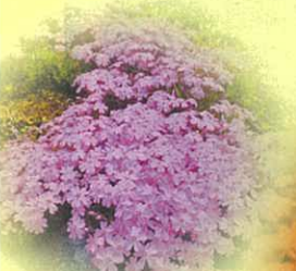
芝ざくら(川口地域)