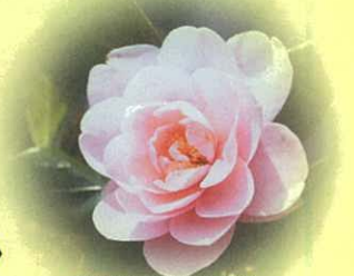
雪椿[雪小国](小国地域)