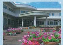
特別養護老人ホーム 桐原の郷