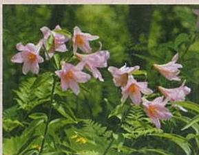
雪国植物園(ヒメサユリ)