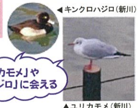
◀キングロハジロ(新川)