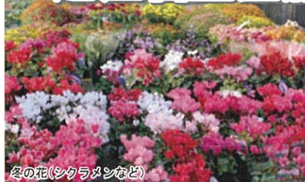
冬の花(シクラメンなど)