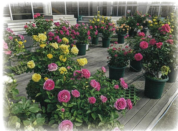
写真 第35回(2025年)全国花のまちづくりコンクール 大賞受賞者 上段左 浦戸諸島「海と花の物語」 / 上段右 佐々木 裕哲 中段 射水市 下段左 名塩さくら台景観緑化クラブ / 下段右 伊奈町立小針北小学校