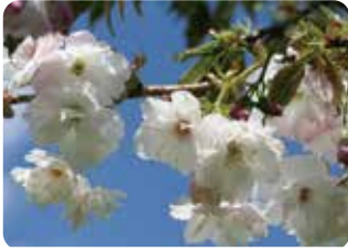
25 伊豆最福寺枝垂 (イズサイフクジダレ) 八重咲・大輪・白色 原木は静岡県伊豆市・最福寺にあり廣沢智純が命名した、大島桜が関係した枝垂れ性品種。