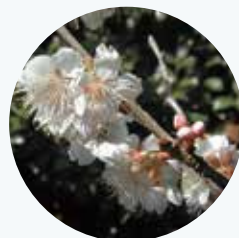
シナミザクラ 支那実桜 開花期：3月

中国原産。この桜と他種が交配した早咲き品種も多い。幹から気根が出やすい特徴がある。