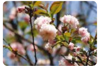
76 泰山府君 (タイザンフクン)