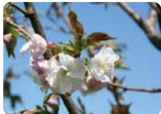
82 八重深山桜 (ヤエミヤマザクラ) 八重咲・中輪・白色 1964年に浅利政俊により深山桜と御座の間匂の交配により作出された、珍しい交配種。