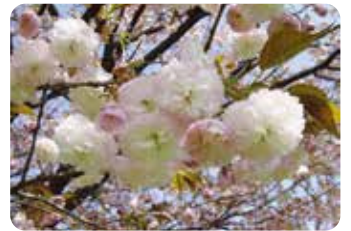
80 普賢象 (フゲンゾウ)

江戸時代から知られる品種で学名の Contorta は、ねじれたを意味し花弁の形状からつけられた。