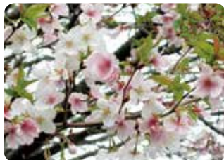
95 越の冬桜 (コシノフユザクラ)※ 一重咲・小輪・白色 富山県上市町と黒部市で発見された二季咲性の品種。花着きがよく、開花期間が長い。