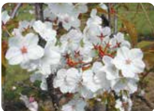
33 枝垂山桜 (シダレヤマザクラ) 一重咲・中輪・白色 山桜系の品種で、枝垂れ性品種の中では枝が太く、横に広がる。別名、仙台枝垂。