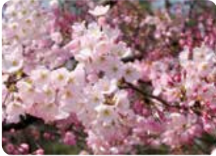
21 神代曙 (ジンダイアケボノ) 一重咲・中輪・淡紅色 都立神代植物公園で発見された桜で染井吉野と同期に開花、花色はやや濃く、花着きもよい。