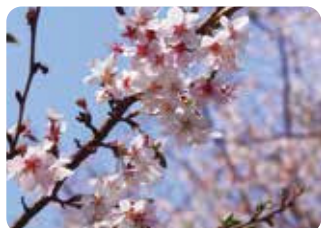
97 四季桜 (シキザクラ) 一重咲・小輪・淡紅色 小彼岸の一重咲で二季咲の品種。同じ名前でも花色や大きさの異なる系統が知られている。