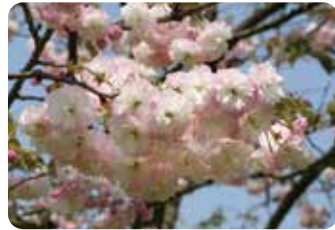
71 松月 (ショウゲツ)

浅利政俊が糸括と里桜の一種の交配により育成した品種で花冠の形状からこの名が付けられた。