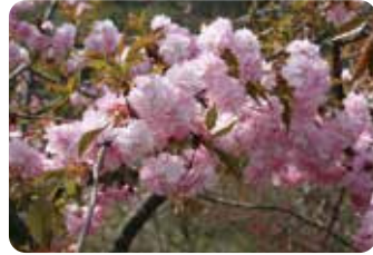
67 菊枝垂 (キクシダレ)

八重桜の代表的な品種で公園や街路などに広く植えられている。海外でも人気が高い品種。