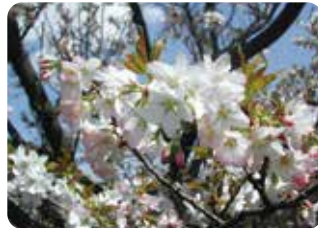
30 苔清水 (コケシミス) 一重咲・中輪・紅色 江北村・荒川堤に植えられていた品種。花は独特の色調で、花弁先端に細かな切れ込みがある。