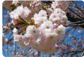
47 一葉 (イチヨウ) 八重咲・大輪・淡紅色 葉化した1本の雌しべが名前の由来。樹勢強健で大木になり、八重桜の中では寿命も長い。