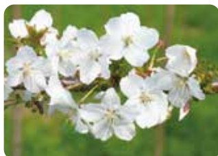
99 冬桜 (フユザクラ) 一重咲・中輪・白色 別名、小葉桜。群馬県の旧三波川村に名所があることから三波川冬桜と呼ばれることもある。