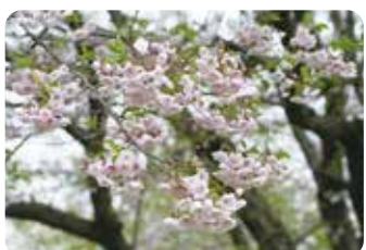
57 仙台吉野 (センダイヨシノ) 八重咲・中輪・淡紅色 坂庭清一郎が八重紅枝垂を母樹に染井吉野を交配して作出した。江戸彼岸八重は異名同品種。