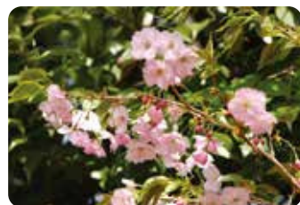
55 朱雀 (シュジャク) 八重咲・大輪・淡紅色 別名・スザク。京都の朱雀にあったのが名前の由来という。小花柄が細く長い点の特徴のひとつ。