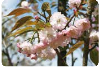
65 大村桜 (オオムラザクラ)