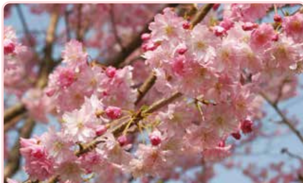
農林水産省登録品種、舞姫（結城農場・桜見本園 作出）