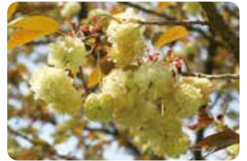
72 須磨浦普賢象 (スマウラフゲンゾウ)

蕾の外側は紅色、開花した花は白色となるため、樹全体が濃淡で彩られ八重桜では最も美しい。