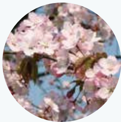
オオヤマザクラ 大山桜 開花期：4月

本州、四国、九州に分布。染井吉野が普及する江戸時代末まではこの桜がお花見の主役だった。