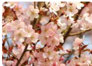
34 仙台屋 (センダイヤ) 一重咲・中輪・紅色 高知県高知市・仙台屋という店にあったことから牧野富太郎が名づけた、山桜系の品種。