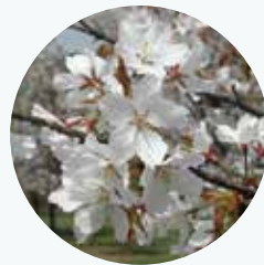
カスミザクラ 霞桜 開花期：4月

北海道から九州に分布。花色から紅山桜、北海道に多いことから蝦夷山桜とも呼ばれる。