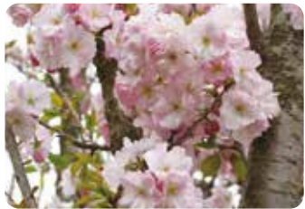
77 東京桜 (トウキョウザクラ)