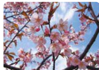
❶ 河津桜 (カワヅザクラ) 一重咲・大輪・紫紅色

伊豆半島の河津町で発見された品種。河津町では2月上旬から約1ヶ月間開花している。