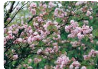
88 極楽寺桜 (ゴクラクジザクラ) 菊咲 (段咲有)・中輪・淡紅色 兵庫県芦屋市で極楽地太一が発見・命名した霞桜の菊咲品種。奈良の八重桜に比べ花弁数が多い。