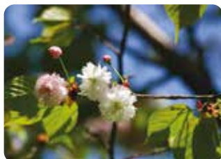
91 奈良の八重桜 (ナラノヤエザクラ) 八重咲・中輪・淡紅色 奈良市・知足院の裏山で発見された霞桜の八重咲品種。奈良県、奈良市の花に選定されている。