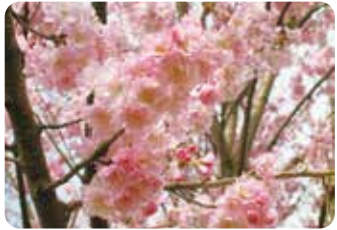
41 舞姫 (種苗登録 No.20923) (マイヒメ) 八重咲・中輪・淡紅色 当会の桜見本園で八重紅枝垂の実生から作出された桜で、樹全体が花で覆われ美しい八重桜。