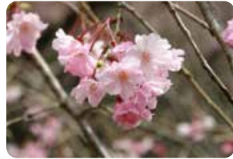
43 八重紅枝垂 (ヤエベニシダレ) 八重咲・小輪・紅色 江戸彼岸の枝垂れ性の品種。同じ名でも花色の濃淡や開花の早晚などに異なる系統がみられる。