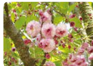
92 鶉桜 (ヒヨドリザクラ) 菊咲 (段咲有)・大輪・濃紅色 絶滅したと考えられていたが、石川県七尾市・法京氏邸で再発見された花弁数が非常に多い品種。