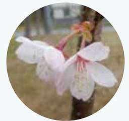
クマノザクラ 熊野桜 開花期：3月