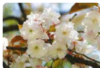
59 手弱女 (タオヤメ) 八重咲・中輪・淡紅色 原木は古くから様々な品種が植えられた京都市・平野神社境内にあった。がく筒にしわが多い。