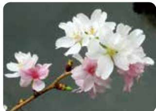
94 越の福かさね (コシノフカサネ)※ 一重八重咲・小輪・白色 富山県入善町と朝日町で発見された。二季咲性で一重咲と半八重咲が混ざって咲く特徴がある。