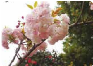
83 楊貴妃 (ヨウキヒ) 八重咲・大輪・淡紅色 江戸や糸括、八重紅虎の尾など類似品種と混同されていたが、がく片の形などで区別できる。