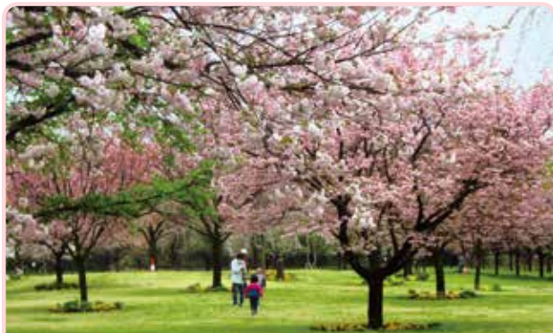
多彩な園芸品種が植えられた結城農場・桜見本園

日本人は、当初は野山に自生する桜を、やがては庭園などに植えて楽しみ、時代とともに園芸品種が誕生してきました。桜の園芸品種とは、何かしらの価値を認めた特定の個体を他の桜と区別するために、人が固有の名前をつけたもので、その内容は花の美しいもの、香りのよいもの、珍しいもの、伝説などの由来に因むものなど様々です。これらの園芸品種は、起源は不明ですが古くから栽培されてきたもの、野生種や野生種間の雑種から観賞性の高い個体を選抜したもの、人為的な交配によって作出されたものなど多彩で現在も新しい園芸品種が誕生しています。