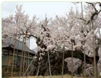
山高神代ザクラ（個体名）