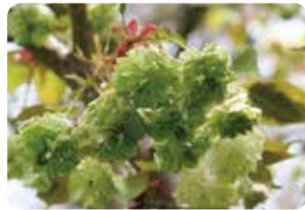
75 園里緑龍 (ソノサトリョクリュウ)

長野県須坂市で発見され羽生田郁雄が命名した普賢象の枝変り品種。時に園里緑龍の花が咲く。