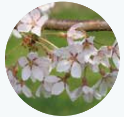
エドヒガン 江戸彼岸 開花期：3月

野生種とは自然の野山に成育している桜で、一定の変異の幅を持つ集団の名前なので、個体差があります。利用上は、その中から選抜した個体を接木増殖した接木苗と種子繁殖により苗木を育成した実生苗があります。接木苗は同じクローンですが、実生苗は個体差があり、場合によっては別の種類の桜と交配した雑種になっていることがあります。