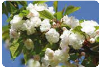
46 市原虎の尾 (イチハラトラノオ) 八重咲・中輪・白色 京都市左京区市原にあった山桜系の品種で、花の着き方が虎の尾状になることから名づけられた。