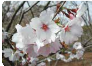
31 御殿場桜 (ゴテンバザクラ) 一重咲・中輪・淡紅色 豆桜と他種の雑種と推定される品種で、挿し木増殖が容易で花着きがよいので鉢植えに適する。