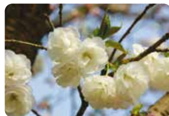
56 白妙 (シロタエ) 八重咲・大輪・白色 江北村・荒川堤に植えられていた品種で代表的な白花の八重桜。蕾は淡紅色を帯びる。