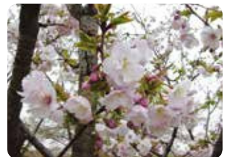
36 高砂 (タカサゴ) 八重咲・大輪・淡紅色 丁字桜と里桜の一種との雑種と推定され、葉や花柄、がくなどに毛が密生する早咲きの八重桜。