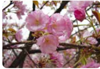
63 八重紫桜 (ヤエムラサキザクラ)

江北村・荒川堤に植えられていた品種で花弁数が5~8枚の花が混在することが名前の由来。