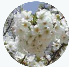
オオシマザクラ 大島桜 開花期：4月

伊豆諸島や伊豆半島原産だが、各地で野生化している。多くの園芸品種の誕生に関係している。