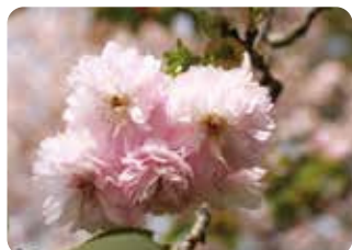
90 名島桜 (ナジマザクラ) 菊咲 (段咲有)・大輪・紅色 1758年発行の桜図鑑「怡顔斎桜品」に掲載されているが、名前の由来は不明と書かれている。