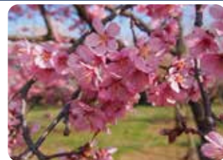
❺ 大寒桜 (オオカンザクラ) 一重咲・中輪・淡紅色