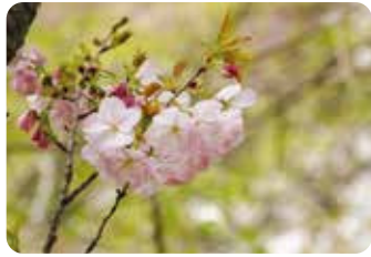
62 御車返し (ミクルマガエシ)