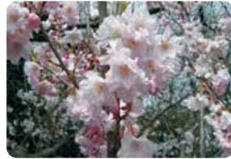
44 八重紅彼岸 (ヤエベニヒガン) 八重咲・中輪・淡紅色 小彼岸の八重咲き品種。枝が横に広がらないことや大木にならないので小庭園にも適する。