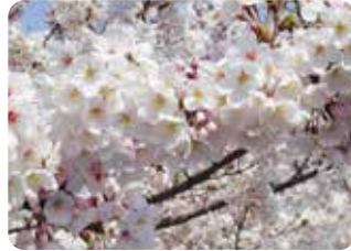
22 染井吉野 (ソメイヨシノ) 一重咲・中輪・淡紅色 花見の名所地を代表する桜だが、伝染病の桜てんぐ巢病に罹るため、各地で問題となっている。