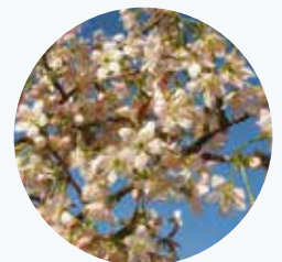
ヒマラヤザクラ ヒマラヤ桜 開花期：10~12月

中国原産。この桜と他種が交配した早咲き品種も多い。幹から気根が出やすい特徴がある。