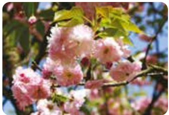
49 妹背 (イモセ) 八重咲・大輪・紅色 京都市・平野神社にあった品種で、一花に二つの果実が実ることを妹背に見立て名づけられた。