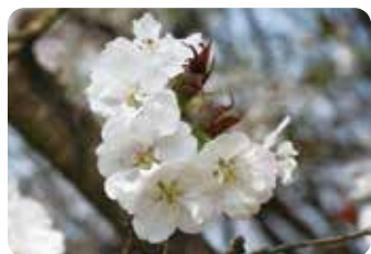
54 御座の間匂 (ゴザノマニオイ) 半八重咲・大輪・淡紅色 この名で栽培されている桜が北海道松前町にあり、船津金松によりこの品種と推定された。