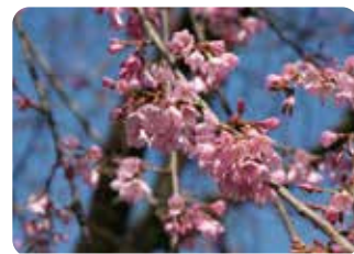
⓭ 高岡越の彼岸 (タカオカコシノヒガン)※ 一重咲・中輪・淡紅色