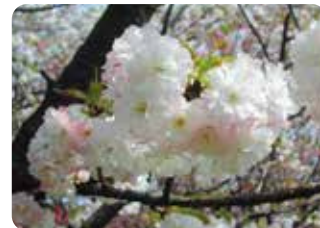
84 蘭蘭 (ランラン) 八重咲・大輪・白色 浅利政俊が白蘭と雨宿の交配で育成した品種。上野動物園にいたパンダ・蘭蘭に因み命名された。