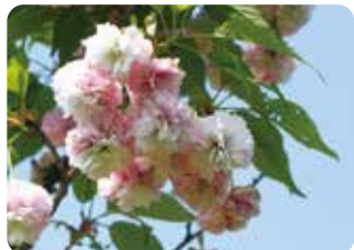
85 菊桜 (キクザクラ) 菊咲 (段咲有)・大輪・紅色 岡山市・旧制第六高等学校にあった桜。六高菊桜と呼ばれたこともあった大島桜の関係した品種。