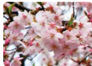
❾ 越の彼岸 (コシノヒガン) 一重咲・中輪・淡紅色

江戸彼岸と近畿豆桜の雑種。複数の系統があるが当会で選抜・増殖した越村型が普及している。