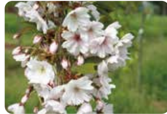
48 早晩山 (イツカヤマ) 八重咲・大輪・白色 江北村・荒川堤に植えられていた品種で、開花終期の花弁中央に紅紫色の筋が入る特徴がある。