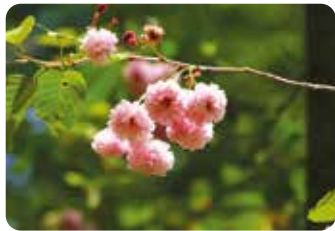
78 梅護寺数珠掛桜 (バイゴジユスカケザクラ)

静岡県三島市・国立遺伝学研究所にあるが余り知られていない品種で樹形が帚状になる。