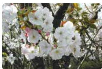
58 千里香 (センリコウ) 一重八重咲・大輪・白色 明治時代に東京の江北村・荒川堤に植えられた品種で、名前は花に芳香があることに因む。