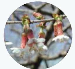
チョウジザクラ 丁字桜 開花期：3月

本州の亜高山帯と北海道に分布。暑さに弱いため、平地では栽培が難しい。別名 峰桜。