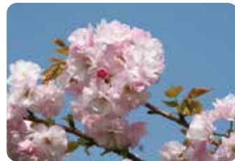
52 江戸 (エド) 八重咲・大輪・淡紅色 八重紅虎の尾、糸括、手毬、東錦と極めて類似。楊貴妃とは萼片の形などで区別される。