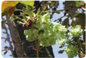
69 御衣黄・小輪系 (ギョイコウ・ショウリンケイ)

開花がやや遅く、黄緑色に緑の筋が入る点が鬱金と異なるとされるが鬱金でも似た系統がある。