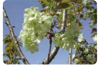
68 御衣黄 (ギョイコウ)

霞桜が関係したと推定される品種で、現在、菊咲の枝垂れ性品種は他に知られていない。