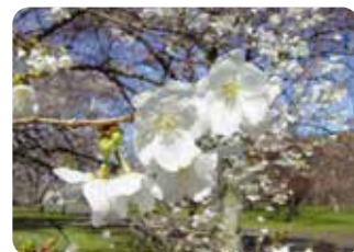
⓱ 雲竜大島 (ウンリウオオシマ) 一重八重咲・小輪・白色