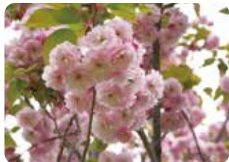
81 紅時雨 (ベニシグレ) 八重咲・大輪・濃紅色 浅利政俊が東錦の実生苗から育成し、紅色の花が垂下して開花するところから命名された。