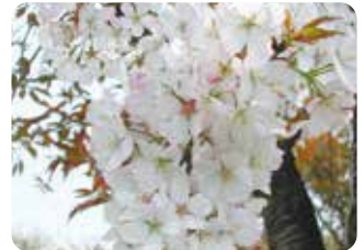
32 静句 (シズカニオイ) 一重咲・中輪・淡紅色 静岡県三島市・国立遺伝学研究所で山桜の実生から選抜された品種。花の芳香から命名された。