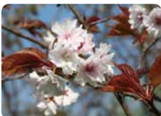
37 天賜香 (テンシコウ) 八重咲・中輪・白色 兵庫県芦屋市で発見された山桜系の桜で花の香りに因み、極楽地太一により命名された。