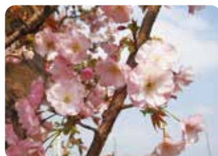
38 華加賀美 (ハナカガミ) 半八重咲・大輪・紅色 当会の桜見本園で奥州里桜の実生から選抜された品種で、美しい加賀の國に因んで名づけられた。