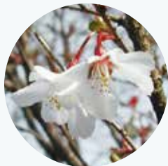
マメザクラ 豆桜 開花期：3月

伊豆諸島や伊豆半島原産だが、各地で野生化している。多くの園芸品種の誕生に関係している。