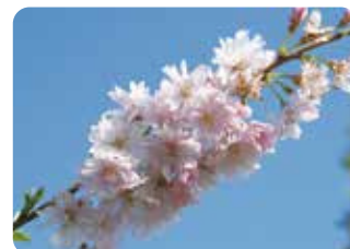
100 穂咲彼岸八重桜 (ホザキヒガンヤエザクラ) 八重咲・中輪・淡紅色 新潟県五泉市・村松公園に原木がある小彼岸系の品種。八重咲の花が穂状に着く特徴がある。