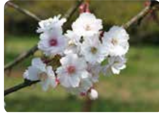
23 薬王寺八重 (ヤクオウジャエ) 八重咲・中輪・白色 福島県会津坂下町・杉村薬師堂にある桜で江戸彼岸と奥丁字桜の雑種と推定される。