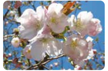
64 横輪桜 (ヨコワザクラ)

三好学が紫桜の実生から選抜した品種。同じ名でも花弁数が異なる系統があり、今後、整理が必要。