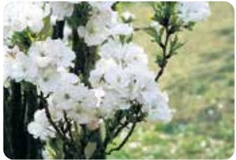
45 天の川 (アマノガワ) 八重咲・中輪・淡紅色 枝が直立し円柱状の樹形になり、狭い場所にも適する品種。花は上向きに開花し、芳香がある。