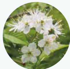
ミヤマザクラ 深山桜 開花期：5月