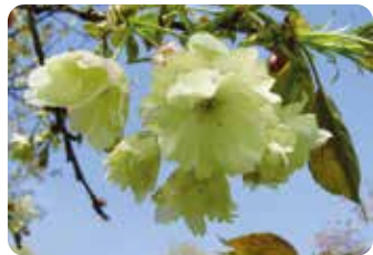
50 鬱金 (ウコン) 八重咲・大輪・黄緑色 江戸時代から知られ、植物のウコンで染めた色に似ていることから名づけられたといわれる。