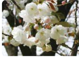
27 永源寺 (エイゲンジ) 八重咲・大輪・白色 滋賀県東近江市・永源寺にあった桜で、花弁数は少ないが花径6cm近い大きな花を咲かせる。