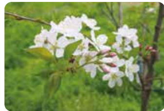
51 薄紅深山桜 (ウスベニミヤマザクラ) 一重咲・中輪・淡紅色 北海道・松前町の松前公園にあった深山桜の実生育成種、他種との雑種と推定される。