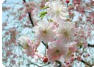
26 雨情枝垂 (ウジョウダレ) 八重咲・中輪・淡紅色 栃木県宇都宮市・野口雨情旧宅に植えられていた枝垂桜の中から発見され、命名された。