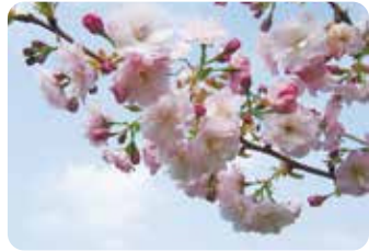
42 八重紅大島 (ヤエベニオオシマ) 八重咲・大輪・淡紅色 伊豆大島で発見され、尾川武雄が命名した桜で、大島桜の品種とされるが他種との雑種という説もある。