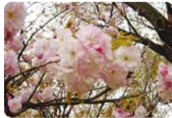
79 福祿寿 (フクロクジュ)

原木は新潟県阿賀野市・梅護寺にあり、親鸞上人の伝説に因んで名付けられた山桜系の品種。