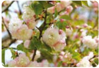
61 紅笠 (ヘニガサ)