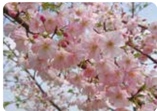
93 アーコレード 半八重咲・大輪・淡紅色 英国育成の春咲品種だが、日本の気候下では春と秋、固定して開花することから二季性とした。