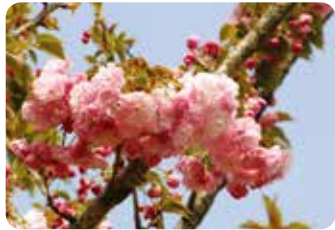
70 紅華 (コウカ)

枝変りと推定される系統で、本来の御衣黄とは異なり、新錦と呼ばれる品種と類似している。