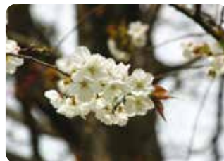
35 太白 (タイハク) 一重咲・大輪・白色 英国の桜研究者・イングラムが日本から導入、栽培していた桜で、日本に里帰りして命名された。