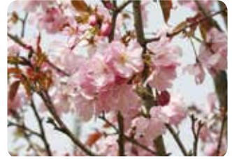
28 奥州里桜 (オウシュウサトザクラ) 半八重咲・大輪・紫紅色 大山桜と里桜の一種が交雑した品種といわれ、岩手県盛岡市周辺でみかけることが多い。