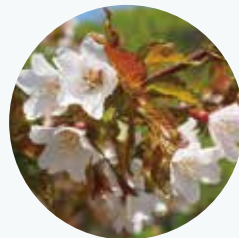
タカネザクラ 高嶺桜 開花期：4月

本州の亜高山帯と北海道に分布。暑さに弱いため、平地では栽培が難しい。別名 峰桜。