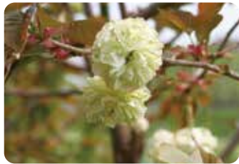
74 園里黄桜 (ソノサトキザクラ)

江戸時代に駿河台 (現東京都千代田区) の庭園にあったといわれ、花の芳香が特によい品種。