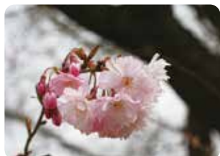
98 十月桜 (ジュウガツザクラ) 半八重咲・中輪・淡紅色 江戸彼岸と豆桜の雑種とされる小彼岸の二季咲品種。同じ名前でも複数の系統がある。