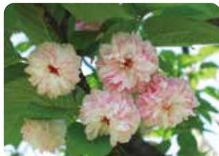
87 兼六園菊桜 (ケンロクエンキクザクラ) 菊咲 (段咲有)・大輪・淡紅色 原木は金沢市・兼六園にあった桜で、慶応年間に孝明天皇より前田家に下賜されたといわれる。