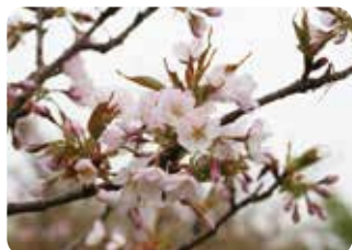
89 静桜 (シズカザクラ) 一重八重咲・中輪・淡紅色 原木は栃木県宇都宮市野沢町にあり、静御前にまつわる伝説が残されている霞桜系の品種。