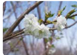
96 子福桜 (コブクザクラ) 八重咲・中輪・白色 支那実桜が関係した品種。誤って十月桜とされることが多いが花色と花弁数で明確に区別できる。