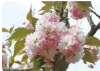
86 麒麟 (キリン) 八重咲・大輪・濃紅色 関山に類似とされるが、麒麟はがく片や葉縁に著しい鋸歯があることで明確に区別できる。