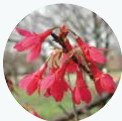
カンヒザクラ 寒緋桜 開花期：3月