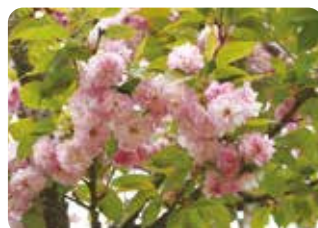
39 火打谷菊桜 (ヒウチダニキクザクラ) 菊咲 (段咲有)・大輪・淡紅色 原木は石川県志賀町・県緑化センターにある。近畿豆桜が関係した雑種と推定される菊咲品種。