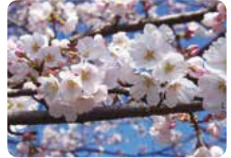
24 陽春 (ヨウシュン) 一重咲・中輪・淡紅色 愛媛県西条市で高岡正明により発見された桜で、染井吉野に似るがやや花が大きく色も濃い。